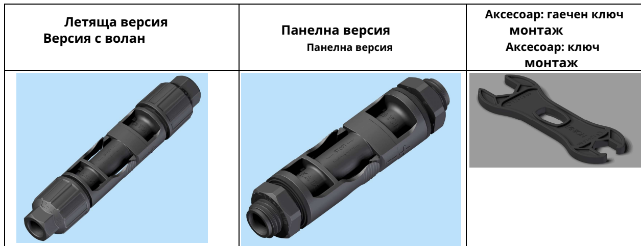
ТАБЛИЦА 1 (кодове) / Таблица 1 (кодиране)