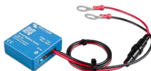
Bluetooth разпознаване Smart Battery Sense