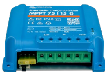
Контролер за зареждане SmartSolar MPPT 75/15