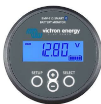
Bluetooth разпознаване BMV-712 Smart Battery Monitor