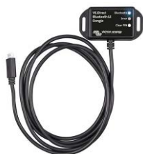
VE.Direct Bluetooth Smart ключ (трябва да се поръча отделно)

Прекалено високо или ниско напрежение на батерията се индикира със звукова и визуална аларма и реле за дистанционна сигнализация.